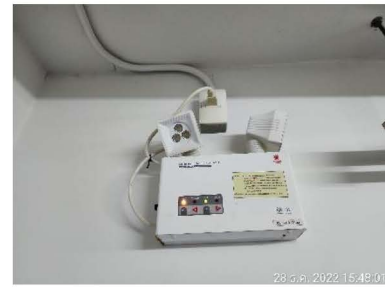
ภาพที่ 1-9 ระบบไฟฟ้าหลักและระบบไฟฟ้าสำรอง