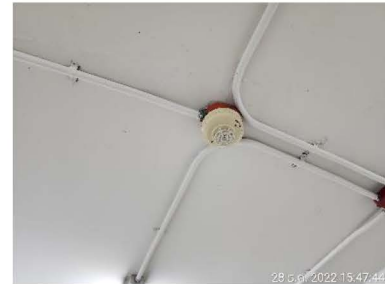
เครื่องตรวจจับความร้อน