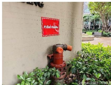
หัวรับน้ำดับเพลิง