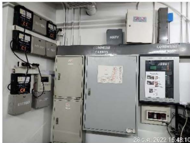
แผงควบคุม