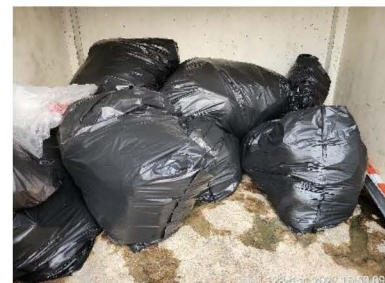
ภาพที่ 1-7 ห้องพักมูลฝอยรวม