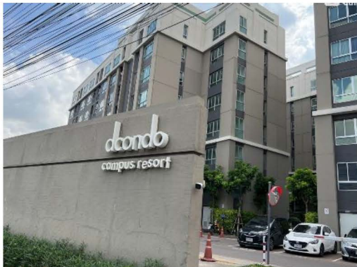
ภาพที่ 1-1 สภาพพื้นที่โครงการในปัจจุบัน

1.2.11 สภาพโครงการในปัจจุบัน : ปัจจุบันโครงการมีการเปิดใช้อาคารอย่างเต็มรูปแบบ รวมไปถึงมีการใช้งาน ระบบสาธารณูปโภคทั้งหมด เช่นระบบน้ำประปา ระบบดับเพลิง ระบบบำบัดน้ำเสีย และระบบอื่นๆ ทั้งนี้มาตรการ ป้องกันฯ ส่วนใหญ่ที่เกี่ยวข้องถูกนำไปปฏิบัติอย่างสมบูรณ์