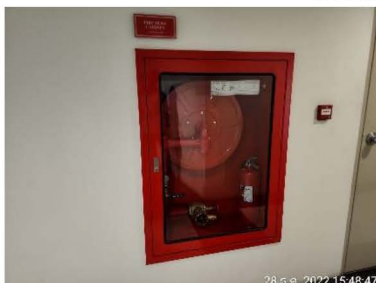
ตู้เก็บสายฉีดน้ำดับเพลิง