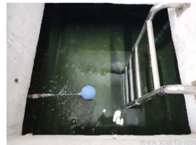
ภาพที่ 1-4 ระบบน้ำใช้