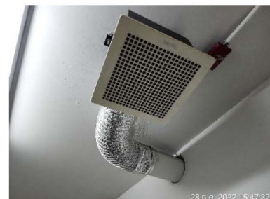
ภาพที่ 1-12 ระบบปรับอากาศและระบบระบายอากาศ