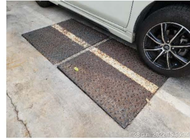
ภาพที่ 1-5 ระบบบำบัดน้ำเสีย