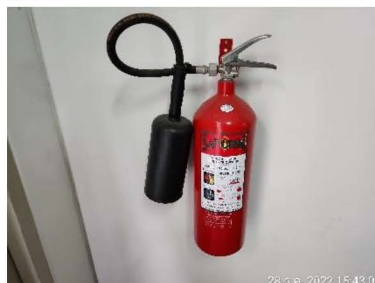
ถังดับเพลิง