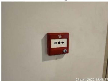
เครื่องแจ้งเหตุโดยใช้มือดึง