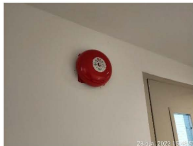
สัญญาณเตือนเพลิงไหม้