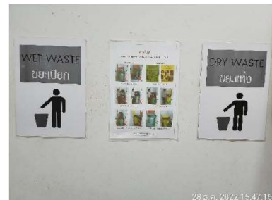
ภาพที่ 1-6 ห้องพักมูลฝอยประจำชั้น