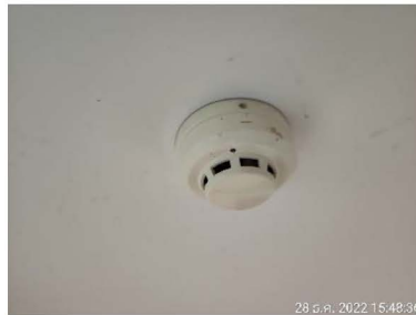
เครื่องตรวจจับควัน