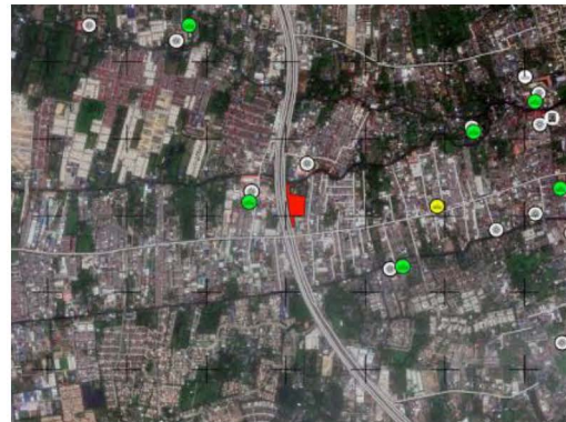
ภาพที่ 1-2 ที่ตั้งโครงการ