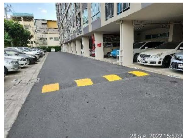
ภาพที่ 1-13 การจราจรในโครงการ