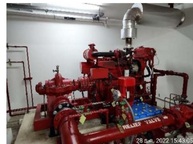
เครื่องสูบน้ำดับเพลิง